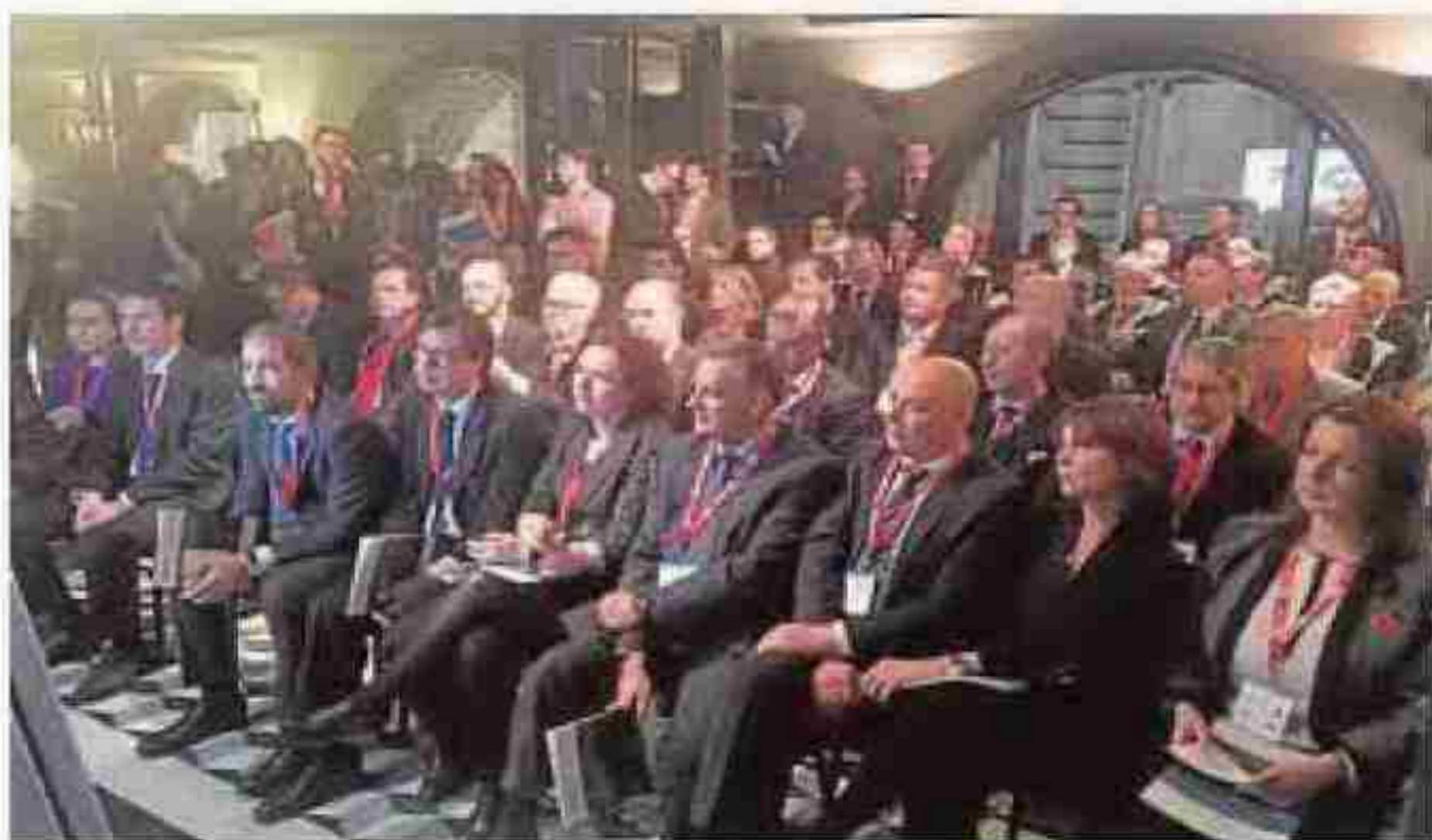
Lleno absoluto en el Hispania de Londres.