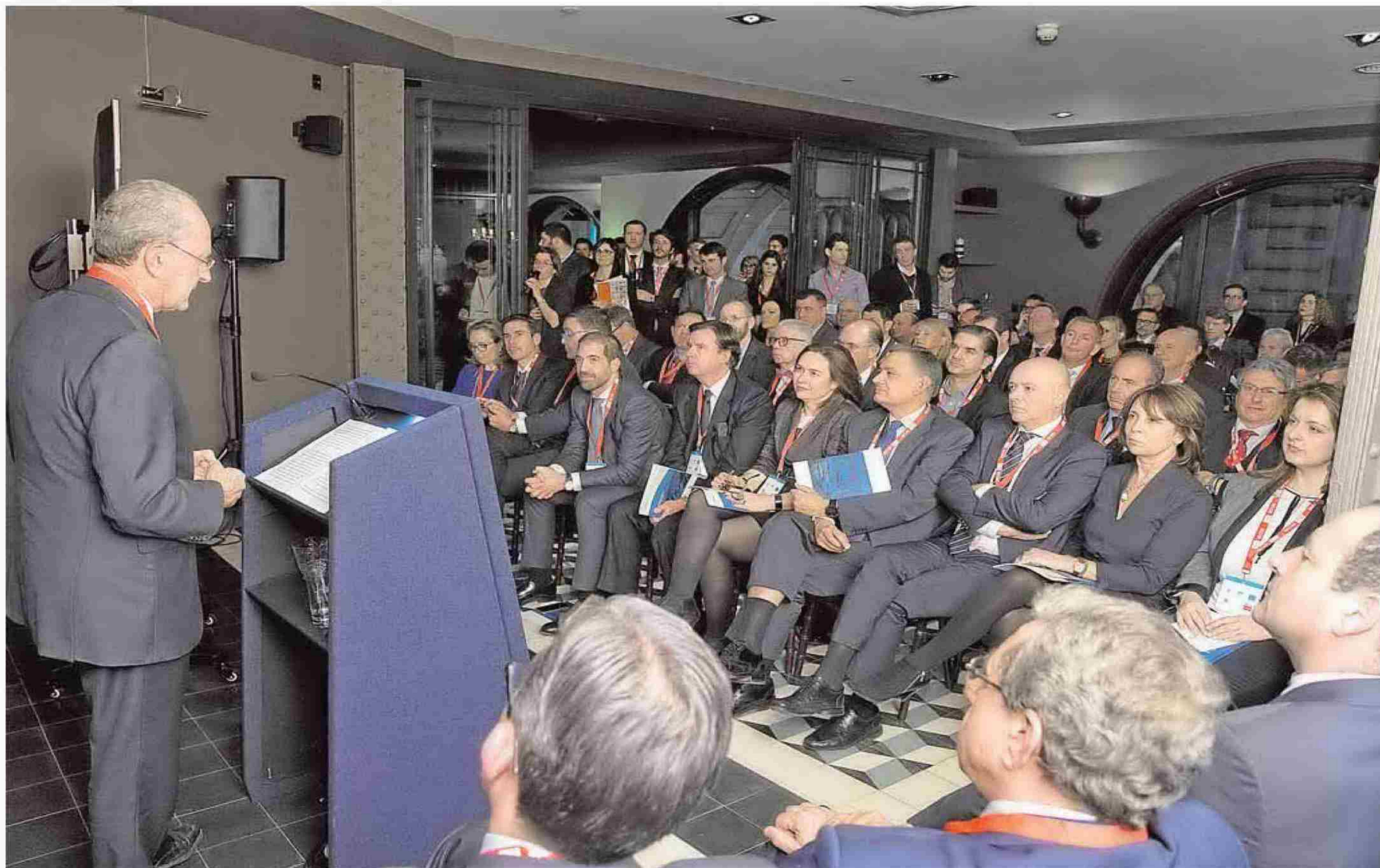
El alcalde interviene en el restaurante Hispania Londres anoche.