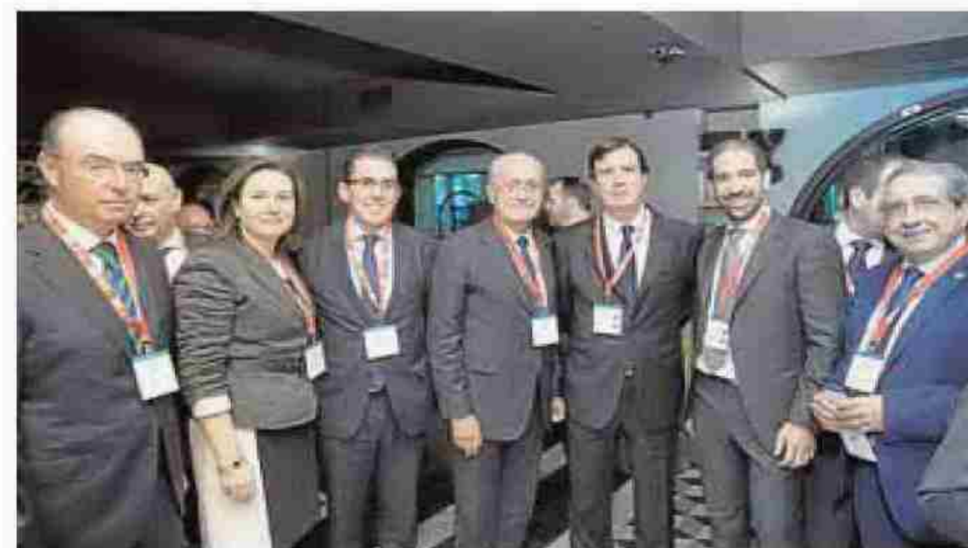
Corral, director de la Fundación Unicaja, con directivos de la entidad, el rector, De la Torre y Martín Rojo.