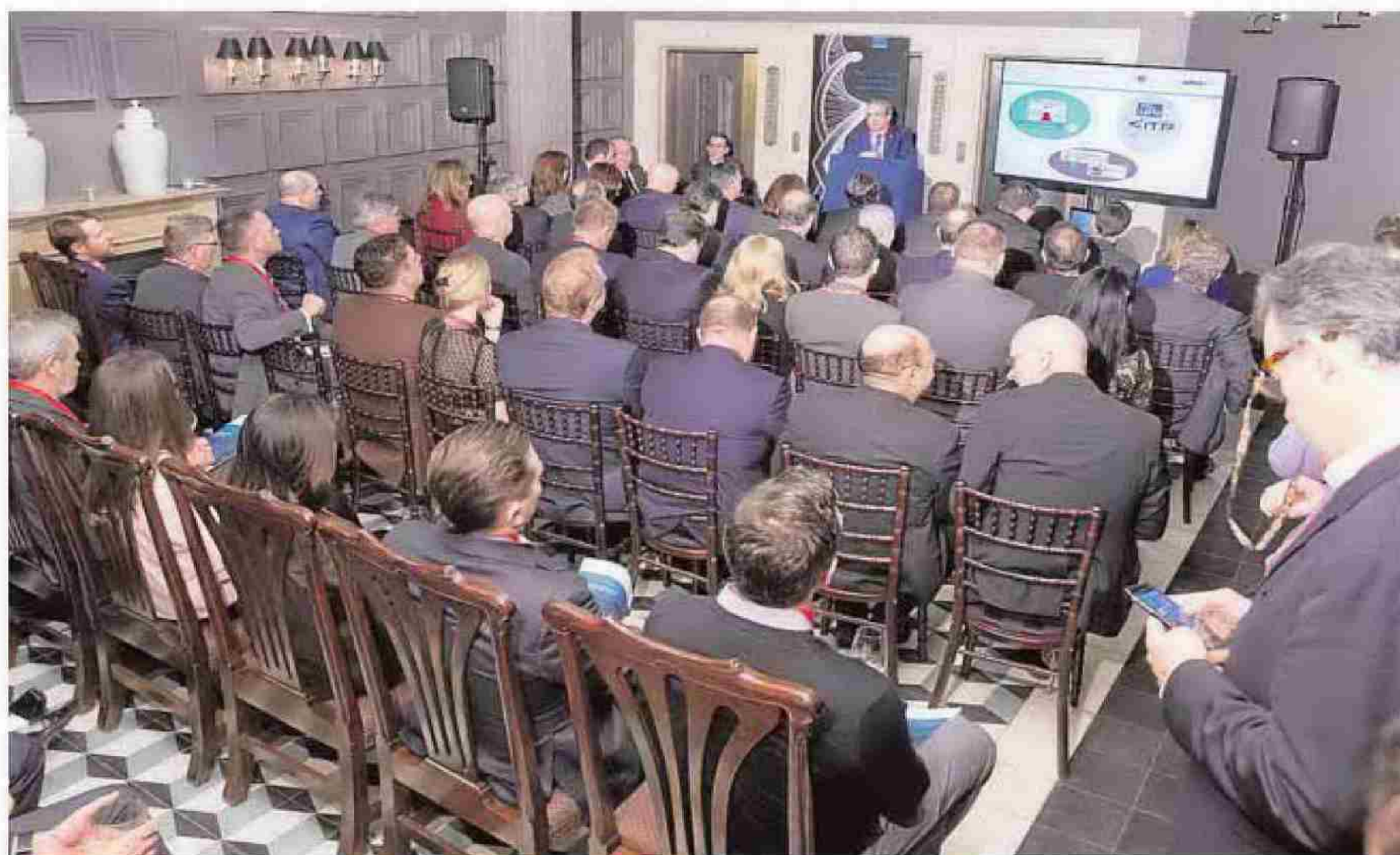
El auditorio del Hispania se quedó pequeño ante la afluencia al I Foro internacional de SUR.