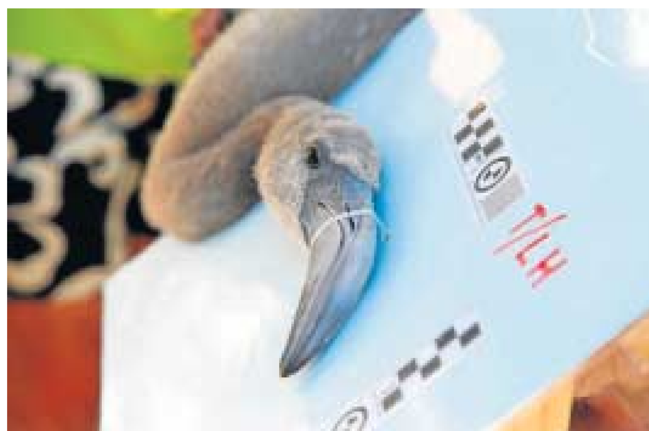
Detalle de la toma de medidas.

La colonia de cría de flamencos en Marismas del Odiel está establecida en el muro que separa las balsas E-11 y E-12 de las Salinas, y según el propio Paraje Natural en lo que llevamos de año se han regis-