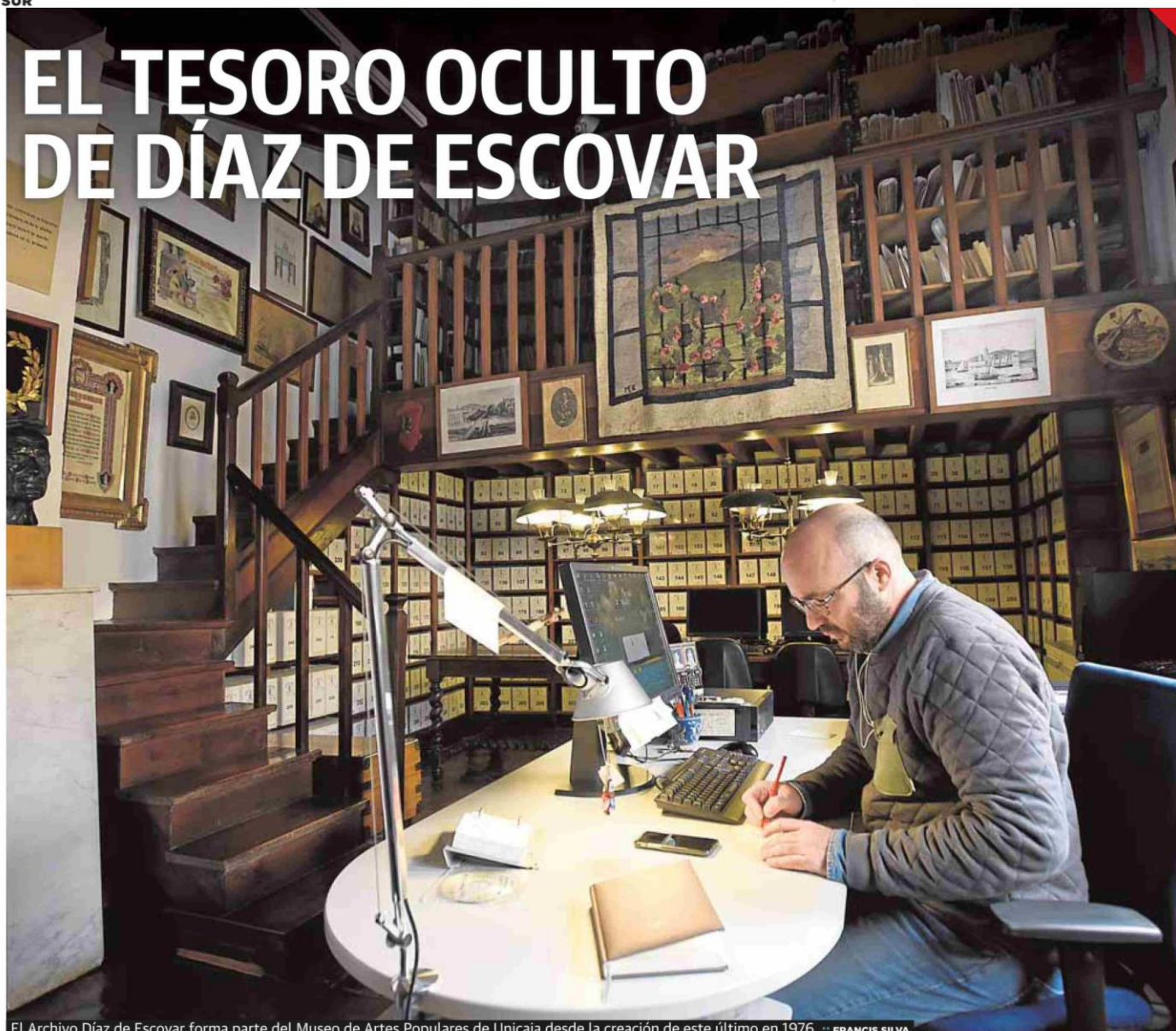
El Archivo Díaz de Escovar forma parte del Museo de Artes Populares de Unicaja desde la creación de este último en 1976.

Una nueva catalogación saca a la luz grabados, fotografías y dibujos incluidos en el archivo perteneciente al Museo de Artes Populares de Unicaja, que suma más de 2.000 obras artísticas en su colección