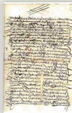
▲ Ordenanzas de la ciudad de Málaga. Manuscrito anónimo del siglo XVI.