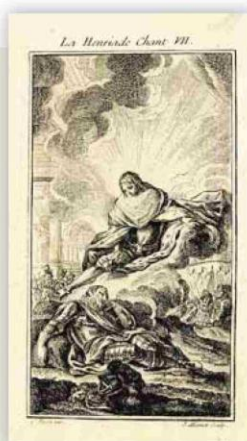
▲ Eisen. 'San Luis apareciéndose a Enrique IV en un sueño' (1751), aguafuerte sobre papel.