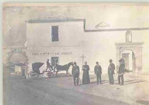
▲ Osuna. 'Asilo de Ntra. Sra. de los Ángeles', Málaga, c. 1900.