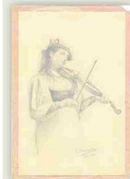
▲ Sánchez Caballero. 'Mujer violinista', 1880, grafito sobre papel, 22,7 x 14,6 cm.

También el siglo XX está representado entre los hallazgos del Archivo Díaz Escovar a través de la obra de autores como Adolfo Fernández Casamayor, Pérez Bermúdez o Kau-