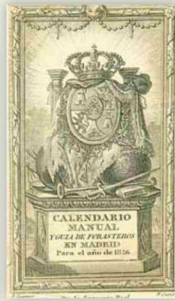
▲ Grabado. 'Calendario manual y guía de forasteros en Madrid para el año de 1826'.