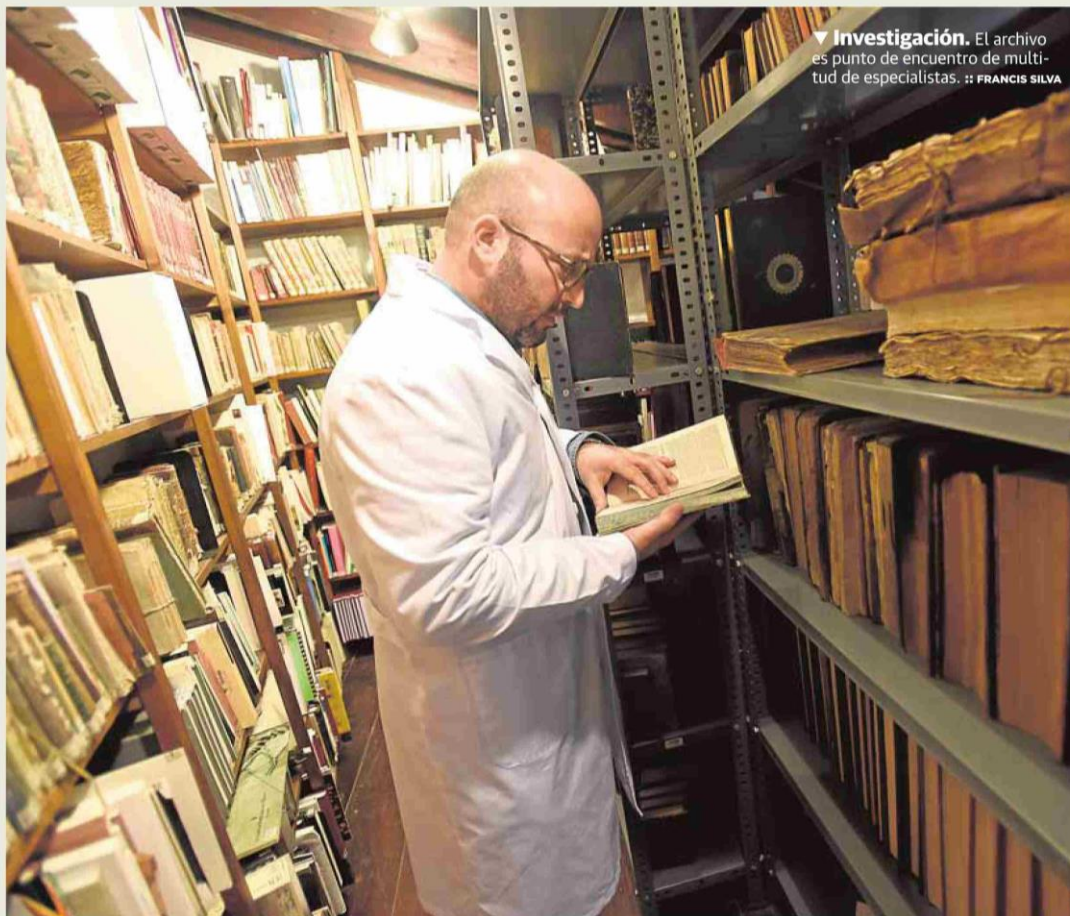
▼ Investigación. El archivo es punto de encuentro de multitud de especialistas.