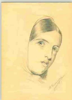
▲ Martín Domínguez. 'Retrato femenino con pañuelo', c. 1879, grafito sobre papel.