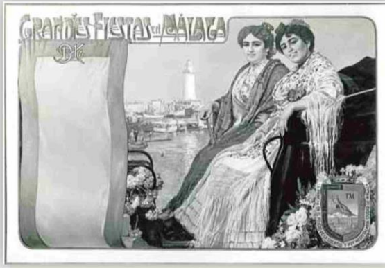
▲ Vivó. 'Grandes Fiestas en Málaga', 1914, óleo sobre lienzo, 123 x 183 cm.