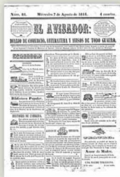
▲ Prensa. Portada de 'El Avisador Malagueño'; n.º 84, Málaga, 7 de agosto de 1844.