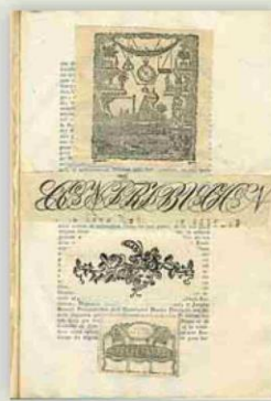
▲ Álbum. Collage anónimo de dibujos y grabados, 29,5 x 20,8 cm., siglos XVIII-XIX.